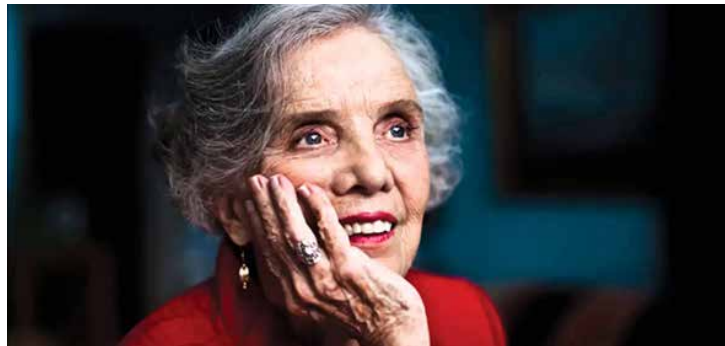
Elena Poniatowska.

Las novelas competirán por un estímulo económico de $500,000 y la ganadora será premiada durante la XVIII Feria Internacional del Libro en el Zó-