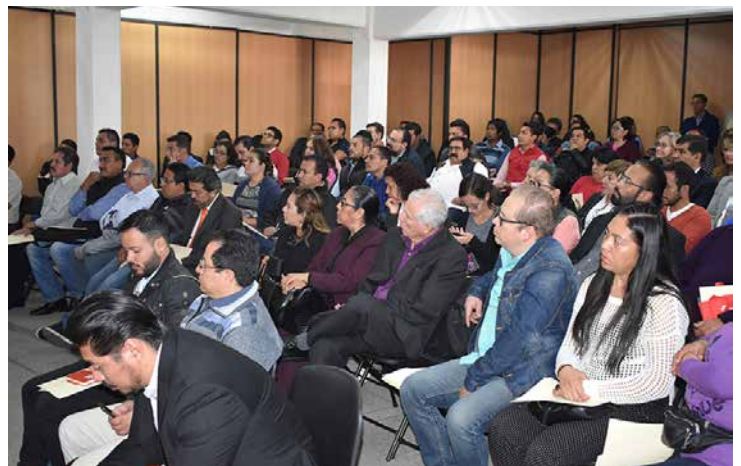
Editores y expositores acudieron a la presentación de las bases de participación.